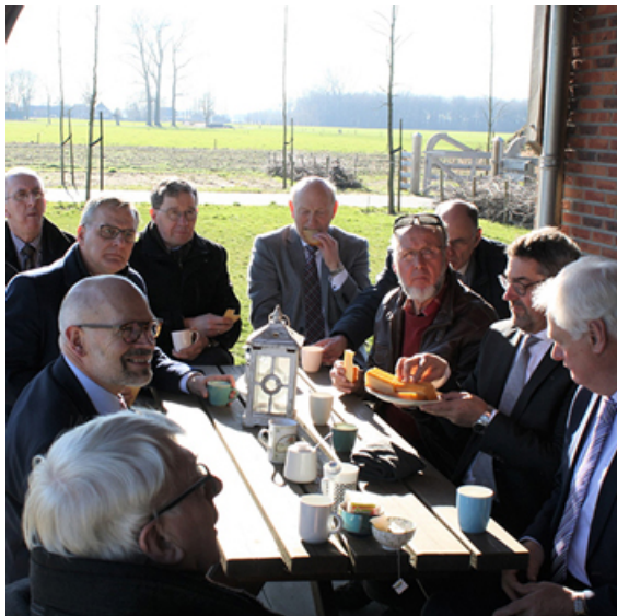
Werkbezoek Vaassen en Epe