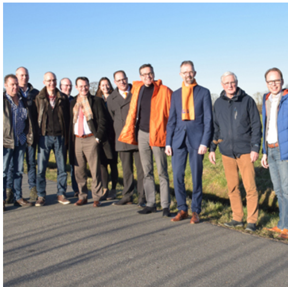
Werkbezoek Ede en Bennekom