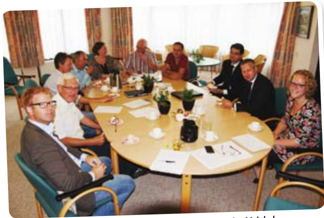
De deelnemers aan het platform Jongeren in Uddel ondertekenen het convenant.

Het platform bespreekt hoe problemen zoals overmatig alcoholgebruik, geluids-