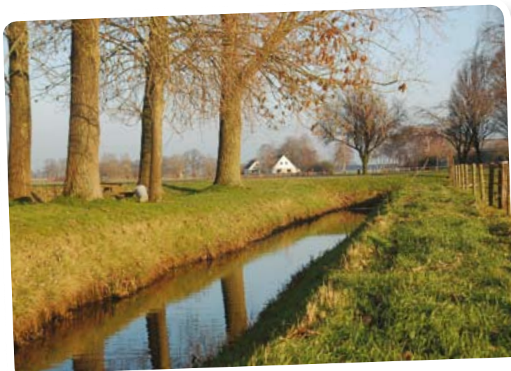
De realisatie van het Landbouw OntwikkelingsGebied (LOG) staat onder tijdsdruk.

forse discussie. De linkse partijen en Gemeentebelangen (die tegen het LOG zijn) bleken bang dat de provincie de agrariërs te veel ter wille zou zijn en wilden het heft liever in eigen hand houden. Zij stemden tegen. De meerderheid, waaronder de SGP, stemde echter in met het voorstel, onder voorwaarde dat de provincie de tot