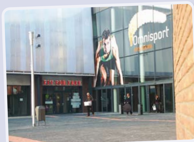
Apeldoorn krijgt veel nieuw winkelopervlak bij het Omnisportcentrum.

Ook vragen wij onder andere aandacht voor een goede bereikbaarheid van de