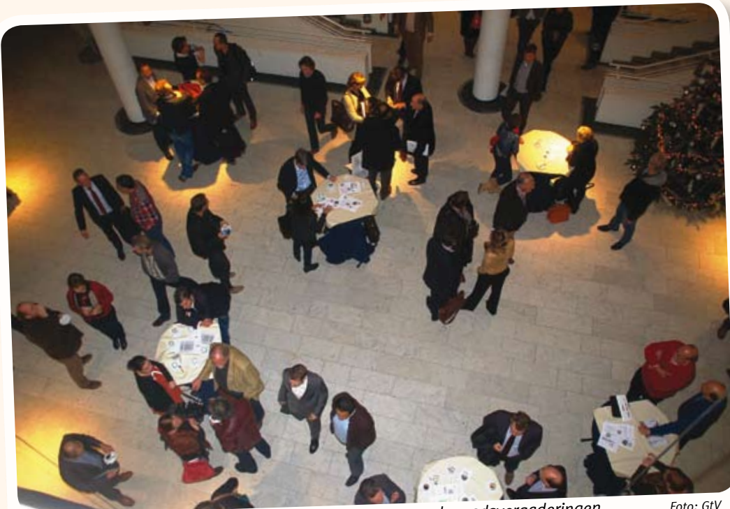
Overleg in de hal van het stadhuis tijdens de pauze van de raadsvergaderingen.

De SGP stemt dit jaar tegen. „De voorgestelde bezuinigingen zijn niet