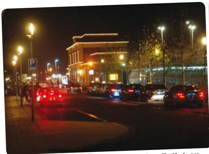
De ruimtelijke kwaliteit van de omgeving is belangrijk. Mede om die reden is het stationsgebied opgeknapt.

Wie heeft er nu geen mening over zijn eigen buurt of leefomgeving? Dat is een goede reden voor de Commissie Ruimtelijke Kwaliteit (CRK) om te peilen welke ideeën er bij burgers leven over hun omgeving. Deze informatie betreft de commissie bij haar adviezen aan het college.