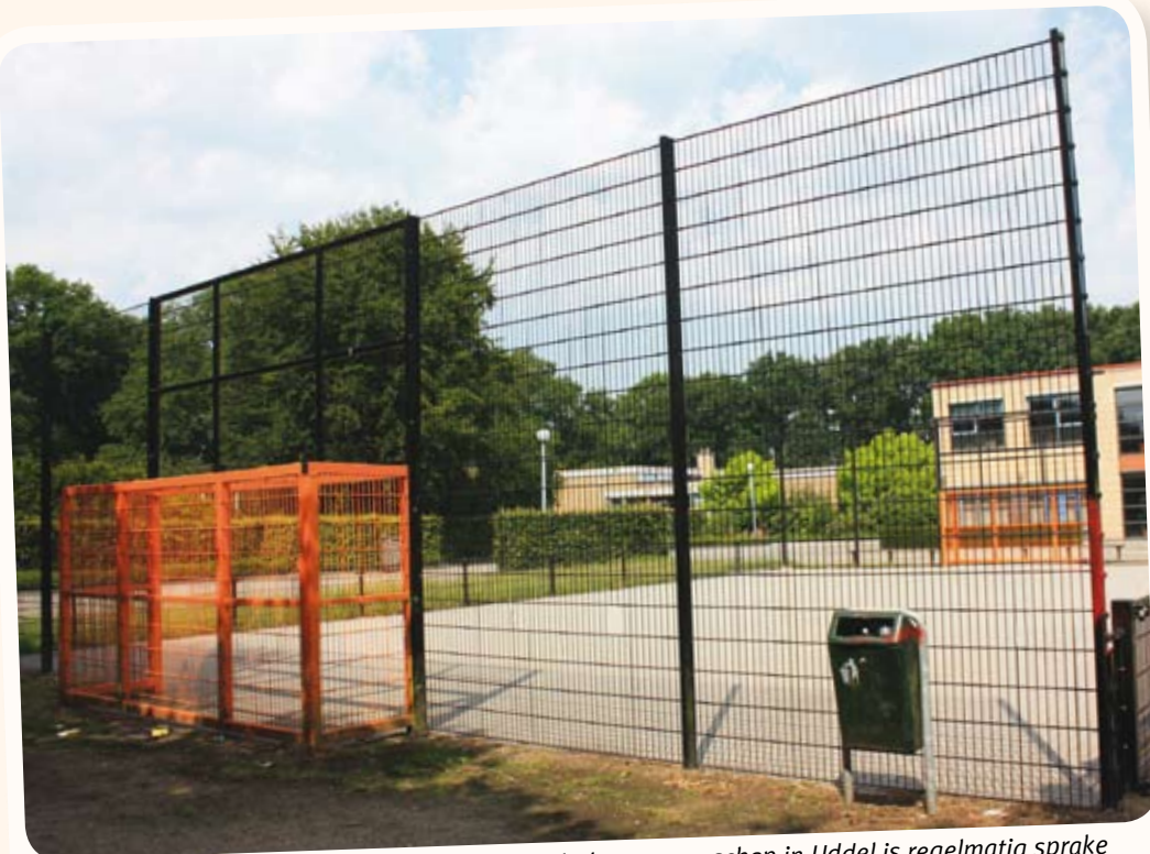
Bij de voetbalkooi achter de Jacobus Fruytierscholengemeenschap in Uddel is regelmatig sprake van overlast door jongeren.

Er wordt door jongeren veel alcohol gedronken, ook op jonge leeftijd. Jongens en meisjes hebben moeite met seksuele grenzen. In het rapport