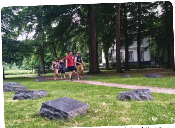
Bij villa Marialust is het Verzetssrijderspark. In het park liggen diverse gedenkstenen met namen van verzetshelden.

dit niet in het gemeentelijke beleid past. Naar aanleiding van het verzoek van de familie is er politieke 'reuring' ontstaan. De gemeenteraad heeft het college gevraagd om het straatnamenbeleid nog eens grondig te herzien. De SGP heeft tijdens een consultatie over dit onderwerp aangegeven dat het waardevol is dat wij onze verzetshelden eren. Dat zou wat ons betreft ook door een straatnaam kunnen. Daar komt bij: de 'voorwaarde' voor vermelding op de gedenksteen dat