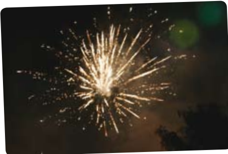
Vuurwerk zorgt voor overlast

In de evaluatie gaf het college aan erg tevreden te zijn over het zogenaamde Aftelfeest op het Marktpllein, waar ruim 4000 mensen naar toe kwamen. De