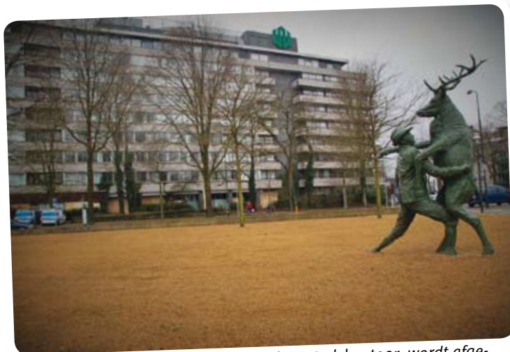
Het gebouw Westpoint, het voormalige stadskantoor, wordt afgebroken. Er komt een Albert Heijn-supermarkt.

passende besluiten kunnen nemen. Het college van B&W heeft aangegeven de gang van zaken te betreuren en dit niet passend te vinden bij de actieve informatieplicht richting de gemeenteraad. Dit